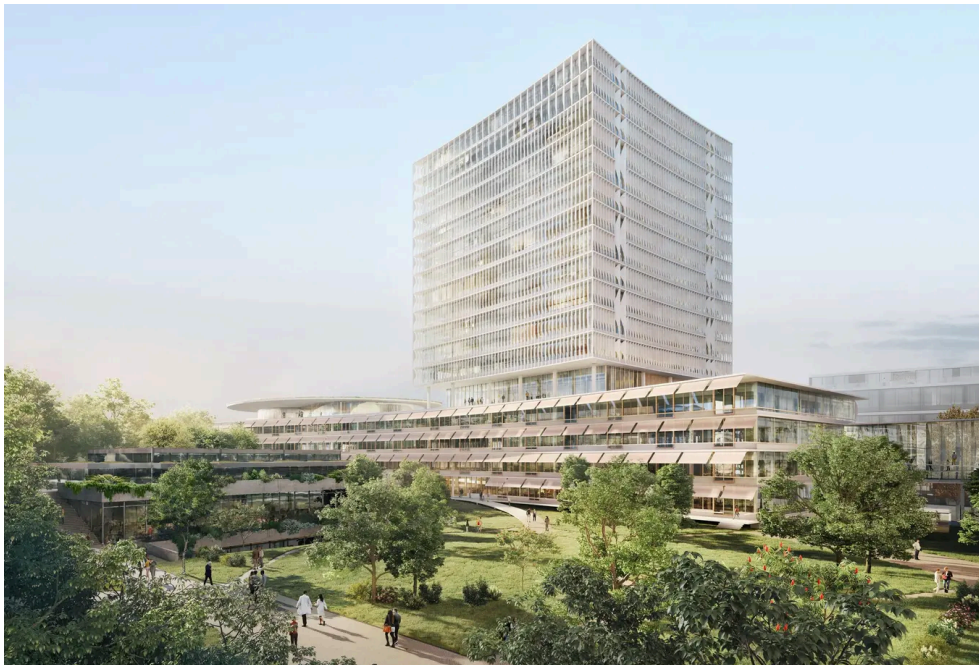
Der Entwurf des Klinikums 3 des Universitätsspitals Basel.

Wir kreieren dadurch eine eigene Landschaft. Spitäler haben – vereinfacht dargestellt – drei Basisfunktionen oder Schichten: die Räume mit der Technik, die Zone, in der Arzt und Patient sich begegnen, sowie die Patientenzimmer. Es ist einfacher, in einer horizontalen Bewegung vom einen Bereich in den anderen zu gelangen. Die Vertikale verstärkt das Trennende.