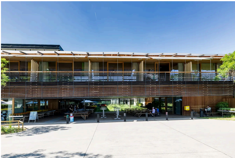
Pionierbau: Das Rehab in Basel, gebaut von Herzog & de Meuron.

Jacques Herzog: Die Frage lautet vielmehr: Wie sieht ein Spital eigentlich aus? Stelle ich mir ein Spital vor, so denke ich an einen hässlichen Bau. Die Spitäler, die ich als Patient kenne, sind technologisch, medizinisch und punkto Betreuung oft exzellent. Aber ihre Architektur ist oft hässlich, ohne die Sorgfalt gemacht, mit welcher die Pflegenden täglich dort arbeiten.